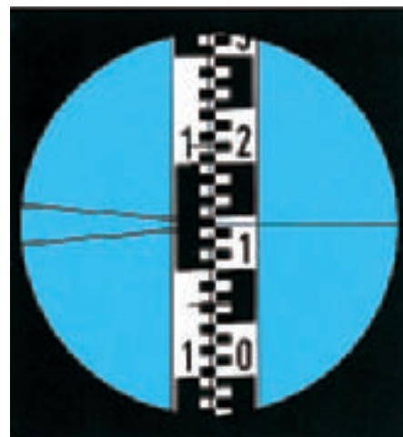
Campo visual del NA2, con mira de nivelación. Lectura en el trazo hz, 1,143 m

El modelo NAK2 tiene un círculo horizontal de vidrio, herméticamente cerrado. Con ayuda de un anillo moleteado se le puede colocar sobre cualquier lectura de partida, lo cual resulta ventajoso al replantear ángulos. Está dividido en grados enteros y se lee en un microscopio de escala situado a la izquierda del ocular del anteojo. Midiendo dirección, distancia y altura es posible levantar o replantear la posición de puntos de detalles en terreno llano.