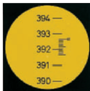
Lectura del círculo horizontal con el NAK2: (400 gon) 392,66 gon