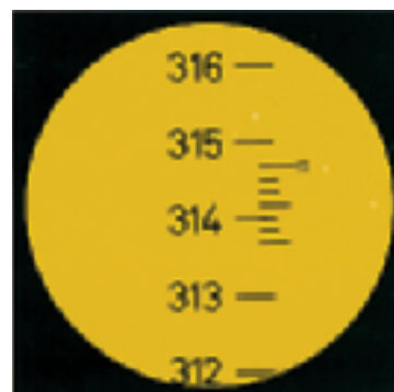
Lectura del círculo horizontal con el NAK2: (360°) 314°42'